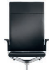
_3 Upholstered backrest, high Rugleuning gestoffeerd, hoog