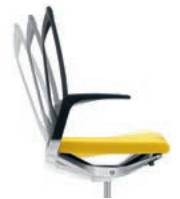
_1 Tilting mechanism Neigmechaniek