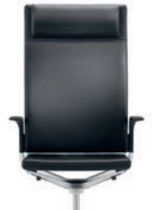
_4 Upholstered backrest, high with headrest Rugleuning gestoffeerd, hoog met hoofdsteun