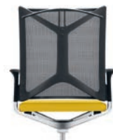
_3 Coat hanger Kleerhanger