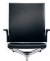
_2 Upholstered backrest Rugleuning gestoffeerd