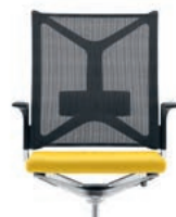
_2 Lumbar support Lumbaalsteun