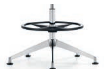
_5 Counter, black aluminium / polished, glides Baliestoel, alu zwart / gepolijst, glijders