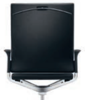
_4 Coat hanger Kleerhanger