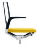
_1 1D Armrests Armleggers 1D