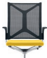
_1 Mesh backrest Rugleuning netweave